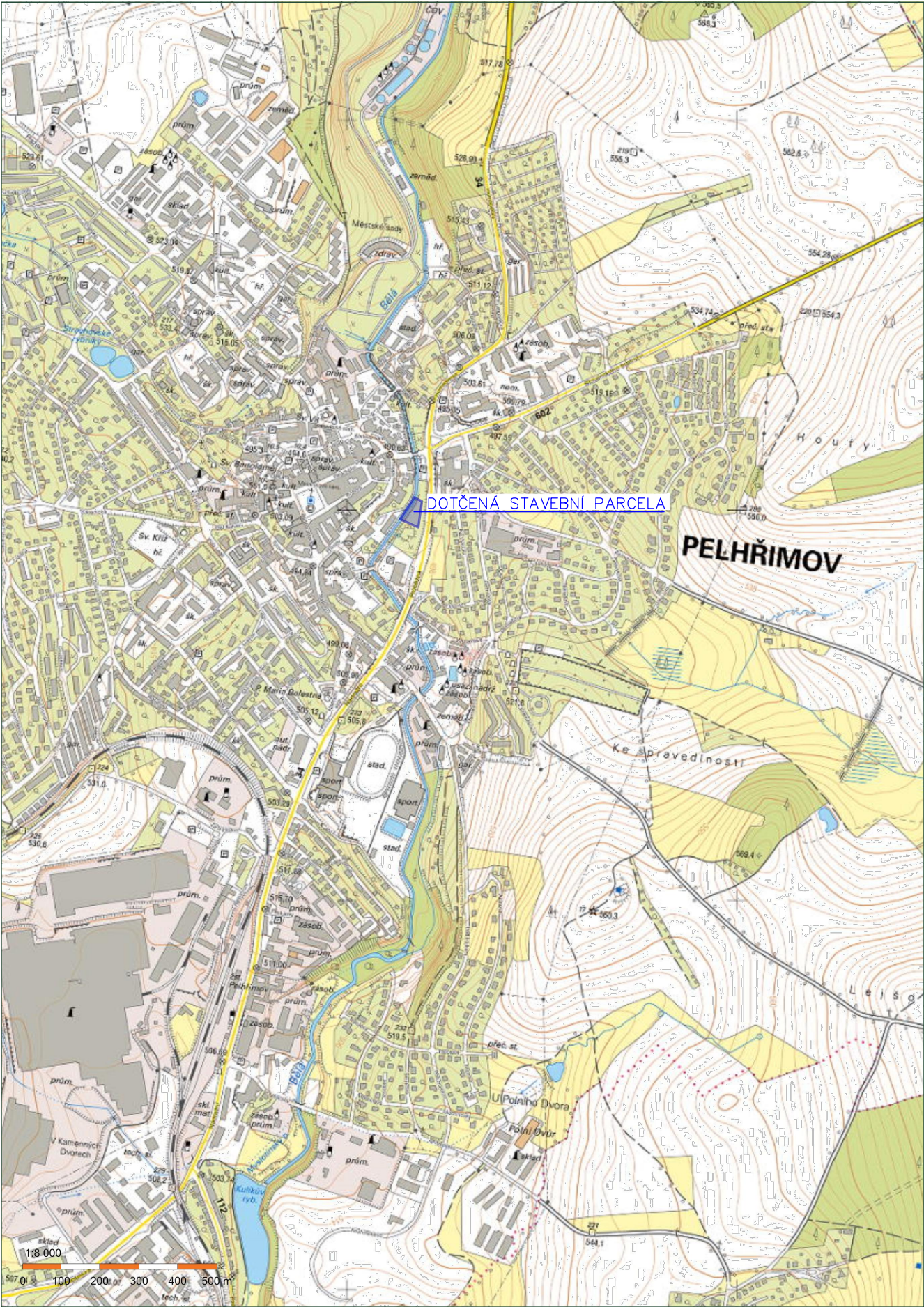
Zákres do mapy ČÚZK, 1:8000